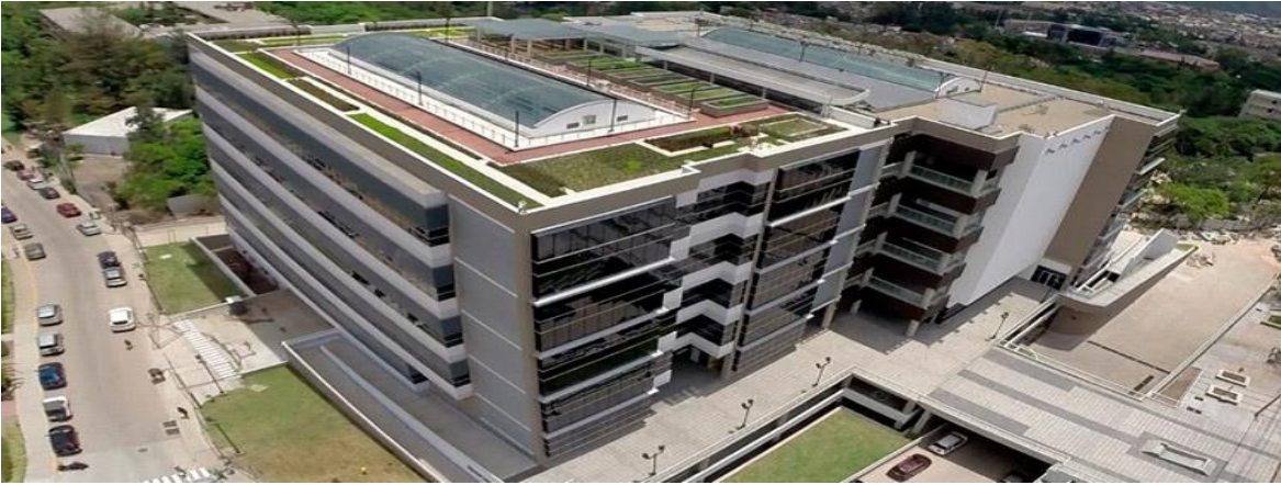
Vista Aérea del Edificio